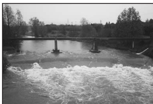
Il fiume Chiese: la storia di Montichiari.

Dal 2008, con i primi incontri estivi e ravvicinati con la popolazione, ne è passato di tempo ed il vincolo del piano