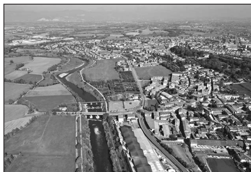
Montichiari e il suo fiume Chiese.

Osservare il fiume da soli o guardarlo in due è cosa diversa, anche i pensieri dell'altro mutano se insieme si confrontano: guarda quel fuscello, e quella foglia che la corrente porta, guarda quella lieve traccia di arcobaleno che danza nel sole del mattino nelle minute goccioline che salgono dalla cascata. E già voliamo col pensiero ai tanti ponti visti o attraversati, o ai quali abbiamo avuto la ventura di affacciarci: il ponte sul l'immenso fiume o su un braccio di mare, sul ruscello o sul torrente di montagna. Si pensa alla sapienza costruttiva