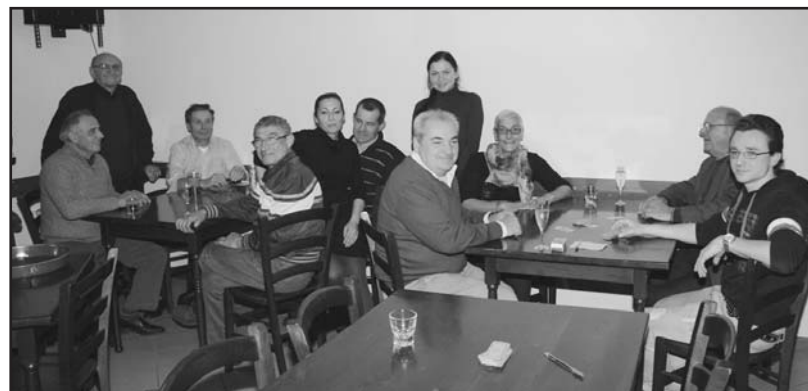
Alcune delle coppie partecipanti alla gara.

E' questo un gioco che prevede molte doti, dalla memoria alla strategia al conteggio dei