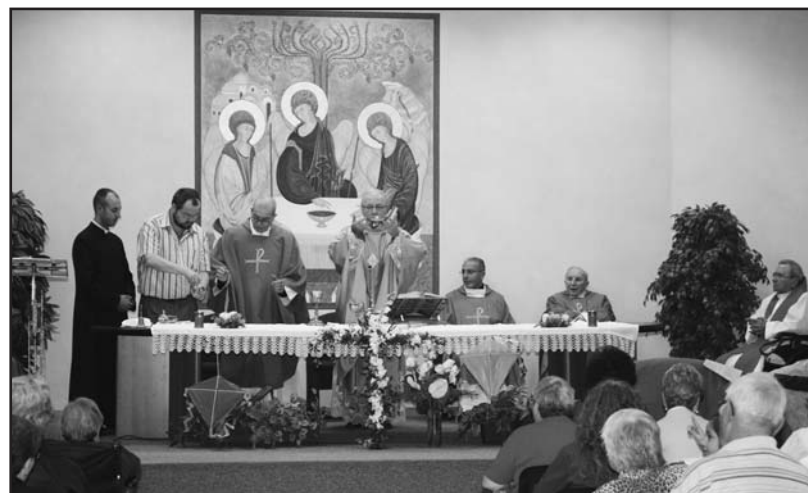
La celebrazione della Santa Messa.